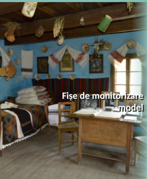
Fișe de monitorizare - model