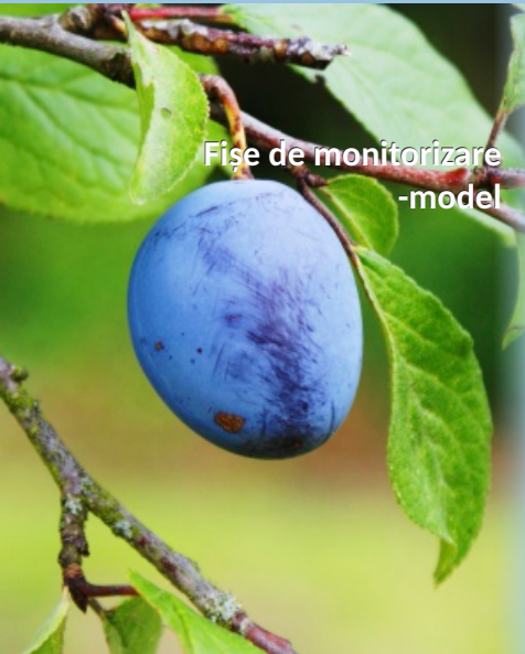
Fise de monitorizare -model

AFIR va realiza în plus propria monitorizare pentru validarea rambursării cererilor de plată depuse de beneficiar pentru investiția ce se realizează.